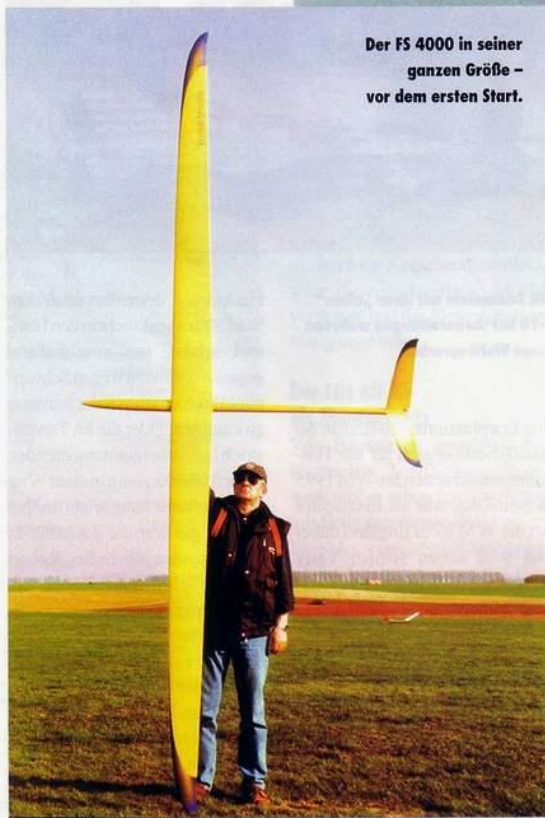
Der FS 4000 in seiner ganzen Größe – vor dem ersten Start.

che Flugleistungen erwartet, wird mehr als überrascht sein.